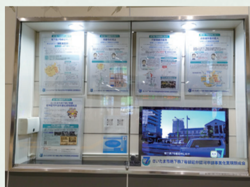
岩槻駅自由通路の展示の様子