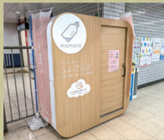
設置型ベビーケアルーム「mamaro」