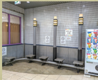
川口元郷駅 ポケット広場

この三点は、SR線のお客さまに対する素敵なおもてなしだと思います。是非、皆さまにも有効活用して頂きたいと思ひます。ちなみに赤羽岩淵駅は、東京メトロの管理駅ですので、この三点はありません。あしからずご了承ください。 渡部史絵 拝