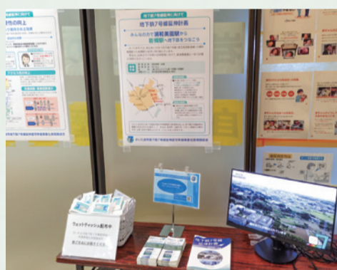
岩槻区役所(ワッツ東館3階ロビー)の展示の様子