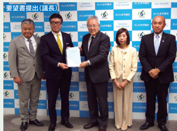
左から松永副会長、帆足議長、筑波会長、西山副議長、新井委員長